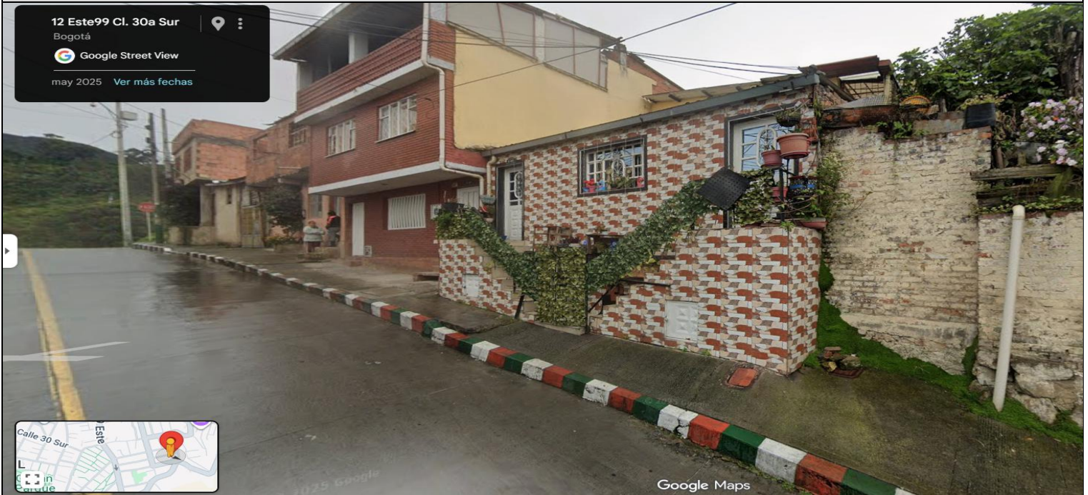
IMAGEN 1: NOMENCLATURA