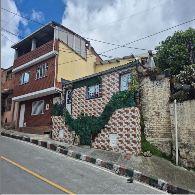
IMAGEN 3: FACHADA LATERAL